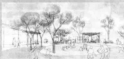
第36回 国土交通大臣賞 一般社団法人渋谷の遊び場を考える会

地域のシンボリックな緑地として人と自然が共生する都市環境の形成、地域の活性化に寄与するプランを募集します。