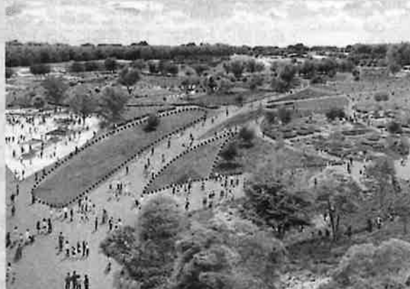
募集プランの対象地(赤破線部 約250㎡ 長さ約90m×幅約2.5~3m)

GREEN×EXPO 2027 (2027年国際園芸博覧会) 会場を彩る緑化プランをご応募ください。世界各国からのEXPO来場者に対し、最初の感動を届けるメインゲート付近を対象地とし、来場者を迎える作品を募集します。