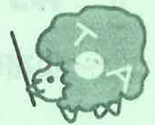
栃木県コミュニティ協会 マスコットキャラクター「コミたん」