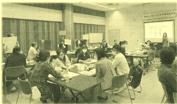
昨年度の外国人との実践ワーク