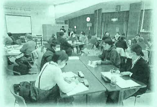
昨年度のサポーター養成講座