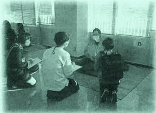
避難所巡回体験の様子