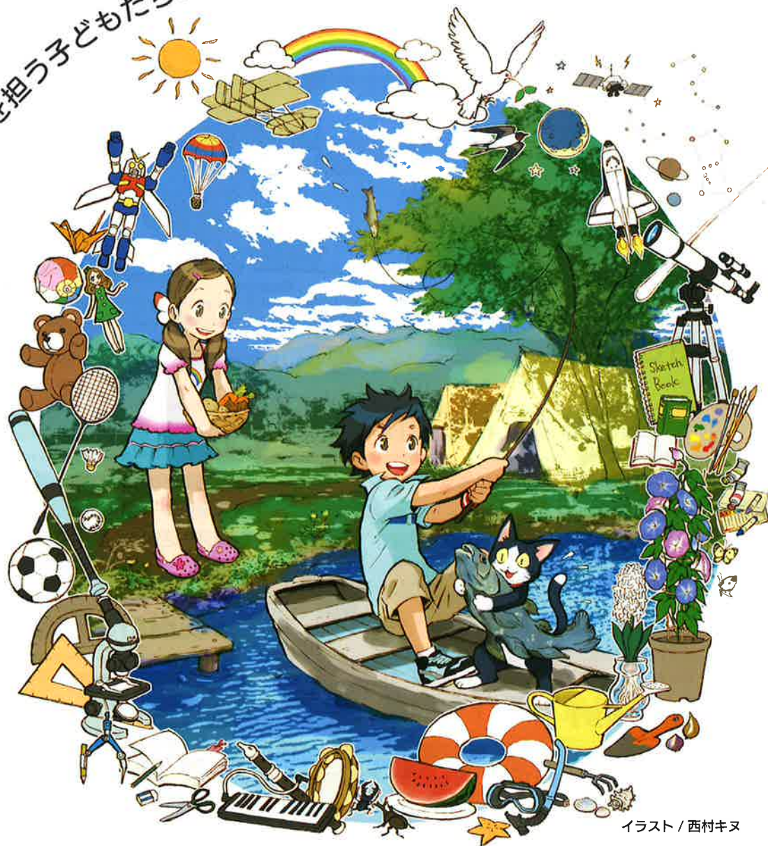
イラスト / 西村キヌ