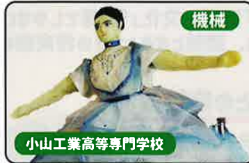
機械 小山工業高等専門学校