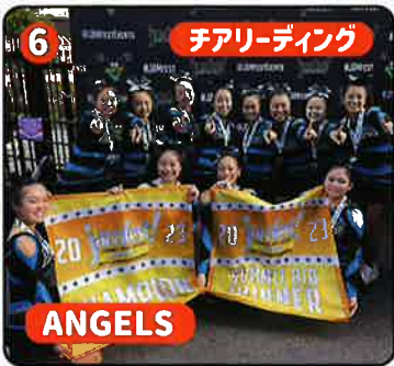
6 チアリーディング ANGELS