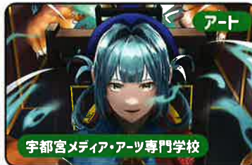
アート 宇都宮メディア・アーツ専門学校