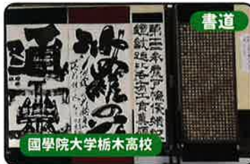
書道 國學院大学栃木高校