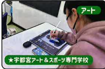
アート ★宇都宮アート＆スポーツ専門学校