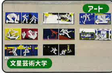
アート 文星芸術大学