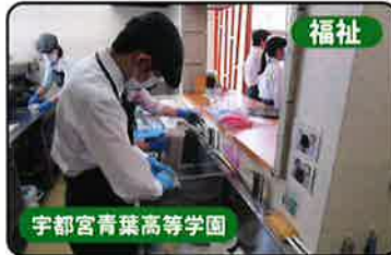
福祉 宇都宮青葉高等学園