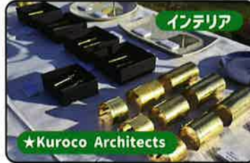
インテリア ★Kuroco Architects