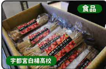
食品 宇都宮白楊高校