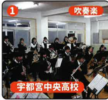
1 吹奏楽 宇都宮中央高校