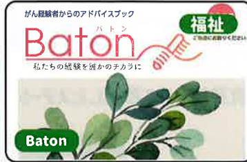
福祉 Baton がん経験者からのアドバイスブック 私たちの経験を誰かのテカラに