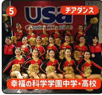
5 チアダンス 幸福の科学学園中学・高校