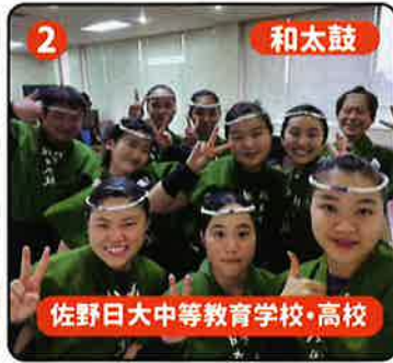
2 和太鼓 佐野日大中等教育学校・高校