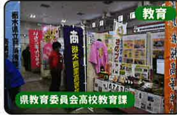
教育 県教育委員会高校教育課

《展示会場での諸注意》 ・展示物には手を触れないでください。 ・★がついているブースでは体験又は物販を予定しております。