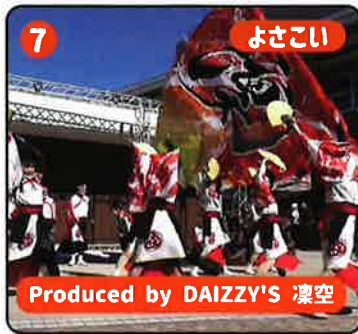
7 よさこい Produced by DAIZZY'S 凜空