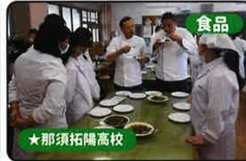
食品 ★那須拓陽高校