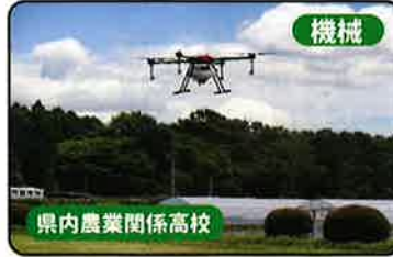
機械 県内農業関係高校