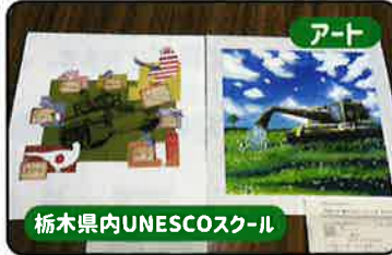
アート 栃木県内UNESCOスクール