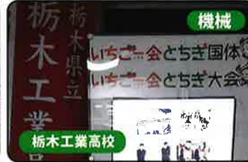
機械 ★栃木工業高校