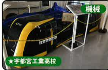
機械 ★宇都宮工業高校