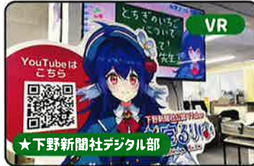
VR ★下野新聞社デジタル部