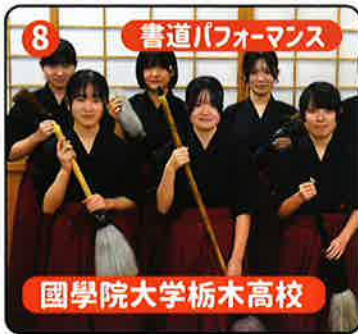
8 書道パフォーマンス 國學院大学栃木高校