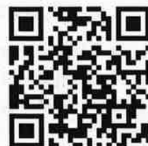
資料ダウンロード (公益推進協会のHP)