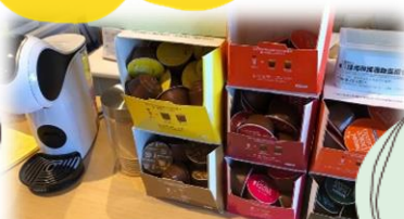
カフェコーナー ◆ .°