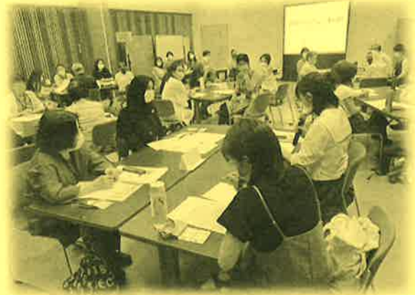
昨年度のサポーター養成講座

※外国人被災者への聞き取り訓練は、基本的に「やさしい日本語」(ゆっくり、簡単な言い方)で行います。