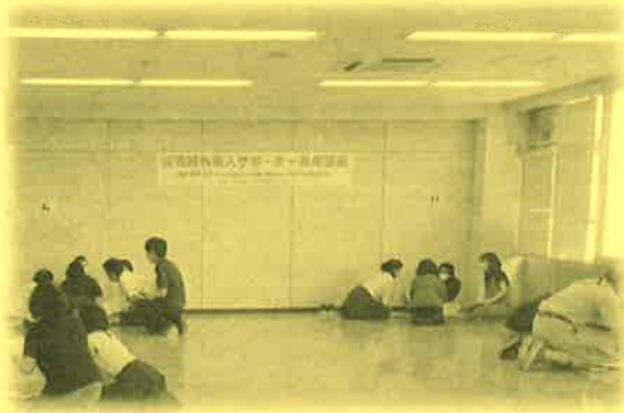
聞き取り訓練の様子