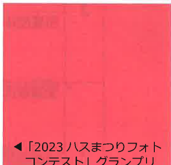
◀「2023 ハスマつりフォトコンテスト」グランプリ