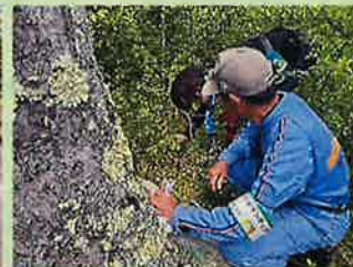
外来植物除去活動