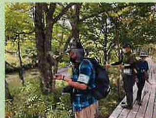
動植物モニタリング