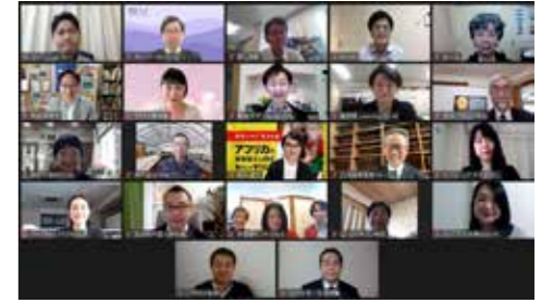
※第8回表彰式受賞団体および来賓、審査委員集合写真