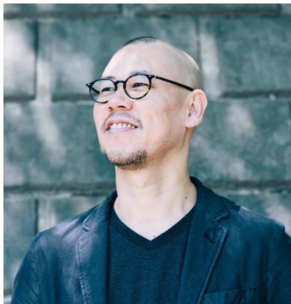
モジョコンサルティング合同会社 代表