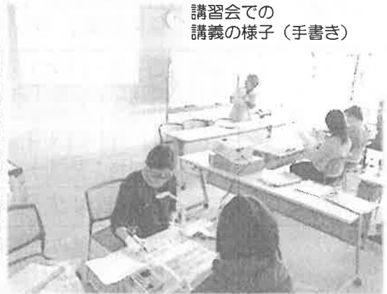
講習会での 講義の様子（手書き）