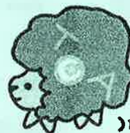
栃木県コミュニティ協会 マスコットキャラクター「コミたん」

E-mail: tochigi-community@rhythm.ocn.ne.jp